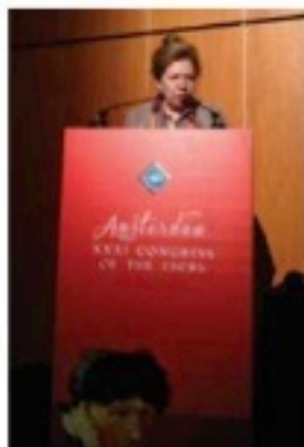
Marie José Tassignon

In occasione del lancio di questo nuovo laser è stato organizzato un Simposio su questo argomento all'ESCRS in cui Marie José Tassignon, dell'Università di Antwerp, Belgio, ha iniziato affermando come le miodesopsie non siano dovute ad un problema psicologico del paziente. Ha poi classificato i CMV in 3 tipi: tipo 1: floaters ben definiti e sospesi da filamenti; tipo 2: floaters multipli e dispersi nel vitreo; tipo 3: floaters ben descritti dal paziente, ma invisibili all'oftalmologo. Il tipo 1 e 2 si apprezzano molto bene alla lampada a fessura e, solitamente, sono localizzati nella parte media del vitreo. La loro velocità di movimento dipende dal grado di viscosità vitreale. Il tipo 3 è percepito come puntini o macchie ad alto contrasto, ben definito dal paziente, anche se l'oculista difficilmente riesce a vederli. Solo con gli OCT di ultima generazione si è riusciti, a volte, ad evidenziarli in una zona detta pre macula bursa, situata entro i 2 mm della macula